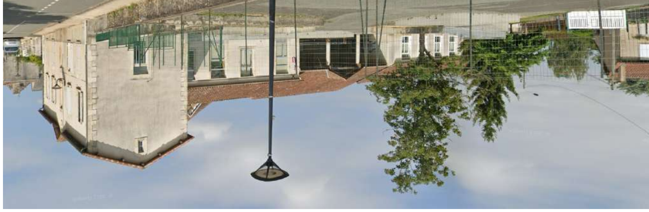
L'ÉCOLE ÉLÉMENTAIRE DE MÉNIGOUTE DEVAIT ACCUEILLIR TOUS LES NIVEAUX À PARTIR DE LA RENTRÉE 2022

Depuis 1994, malgré les oppositions maintes fois réitérées de tous les conseils municipaux de Saint-Germier, nos enfants ont subi une organisation scolaire qui les pénalisait doublement, d'une part en devant passer deux voire trois années scolaires à 16 kms avec changement de bus, d'autre part en devant perdre 40 minutes matin et soir pour regagner leur établissement scolaire situé pour la plupart à 4 kms. À la rentrée 2022, cette organisation sera enfin totalement revue dans le cadre d'un grand projet visant à renforcer le pôle pédagogique de Ménéigoute, dont l'un des volets sera la transformation de cette école qui disposera de tous les niveaux scolaires, de la maternelle au CM2. Les transferts sur Vasles seront alors supprimés. La coordination des horaires entre l'école et le collège devra aussi permettre un départ commun de tous les enfants vers le collège et l'école élémentaire.